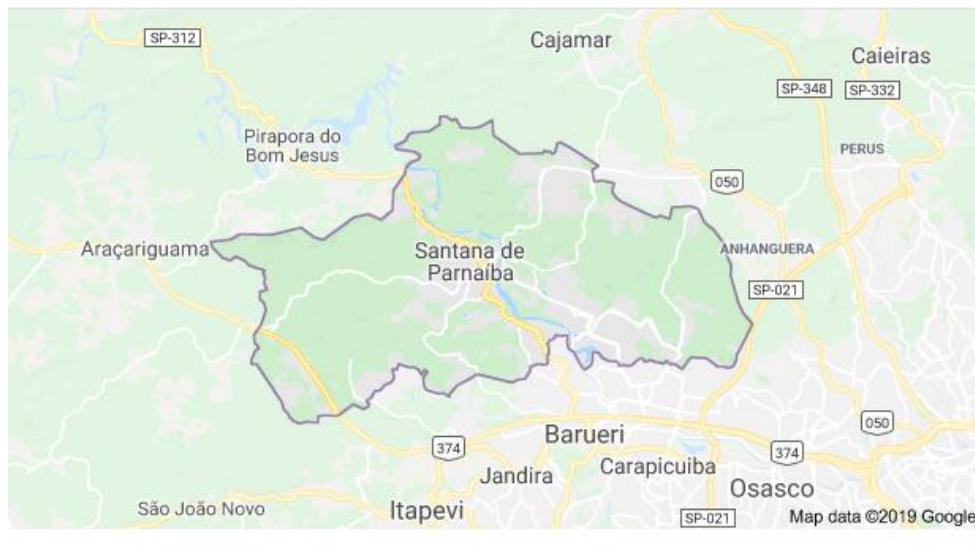
Mapa de Santana de Parnaíba

Segundo INGE, entre 2000 e 2010, a população de Santana de Parnaíba cresceu a uma taxa média anual de 3,82%, enquanto no Brasil foi de 1,17%, no mesmo período. Entre 2000 e 2010, a razão de dependência no município passou de 51,73% para 41,54%. Representando aumento da população econômica ativa. Já na UF, a razão de dependência passou de 65,43% em 1991, para 54,88% em 2000 e 45,87% em 2010. Em 1991, esses dois indicadores eram, respectivamente, 69,14% e 2,34%.