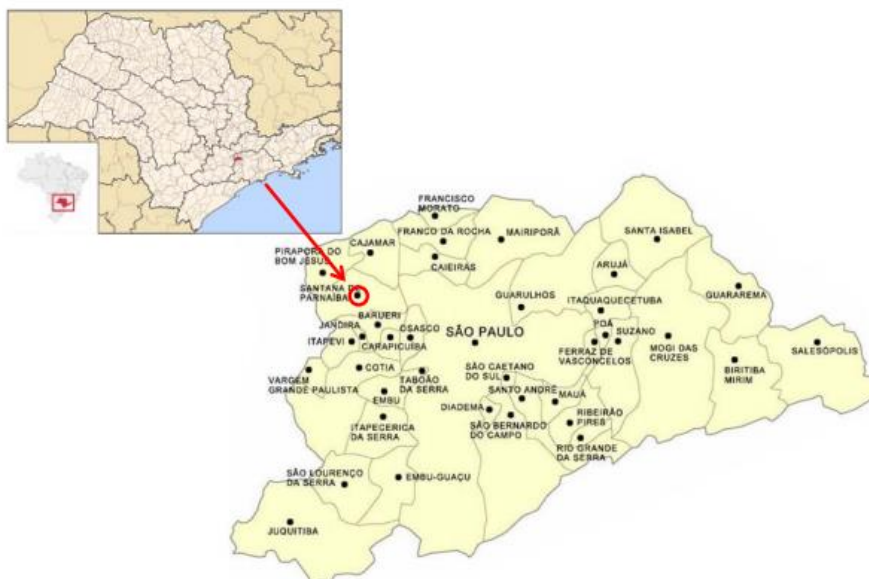
Localização de Santana de Parnaíba

A cidade de Santana de Parnaíba está localizada na Mesorregião Metropolitana de São Paulo e Microrregião de Osasco, com 180,39 Km 2 e 108.813 habitantes segundo Censo de 2010.